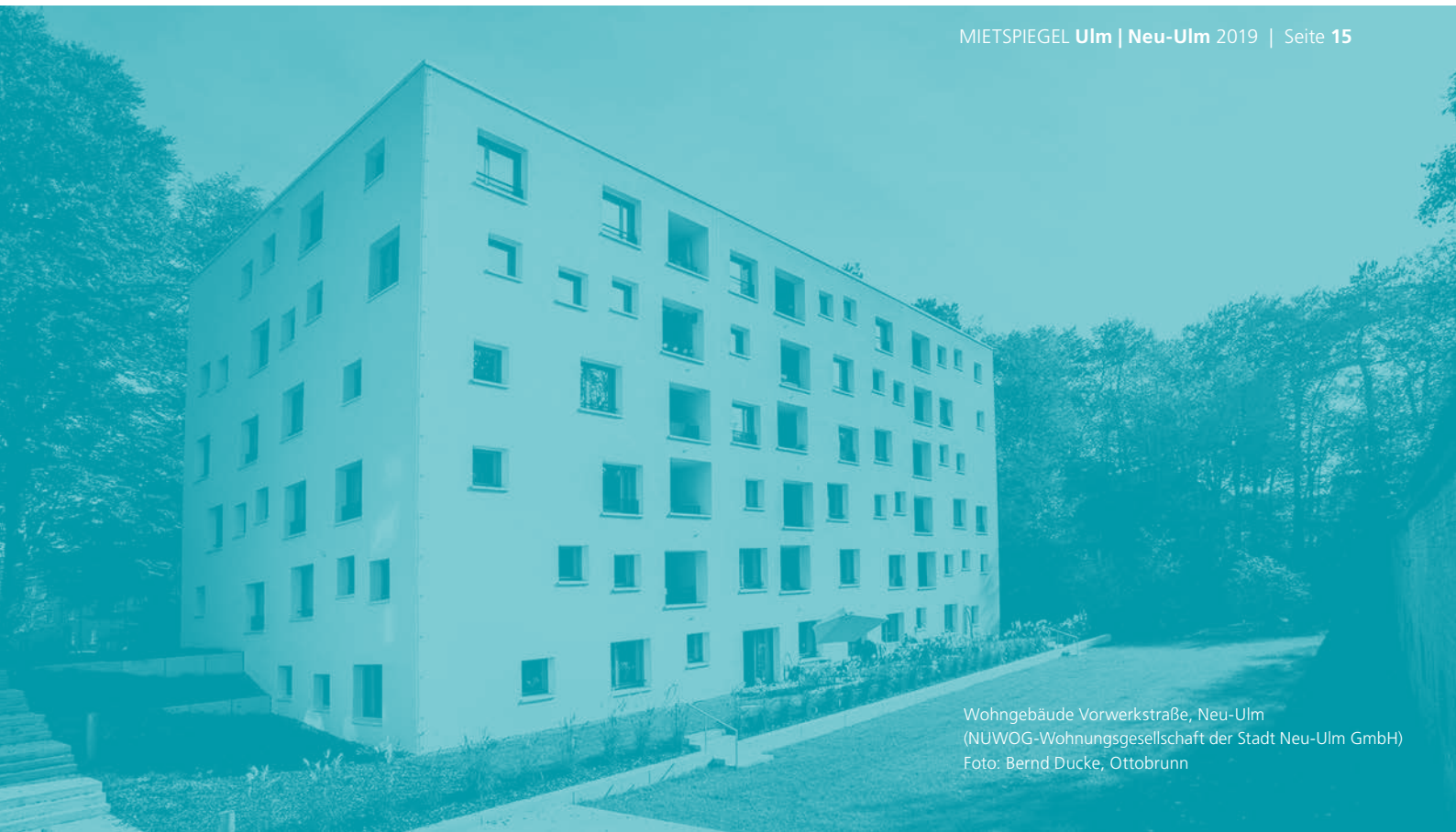
Wohngebäude Vorwerkstraße, Neu-Ulm (NUWOG-Wohnungsgesellschaft der Stadt Neu-Ulm GmbH)