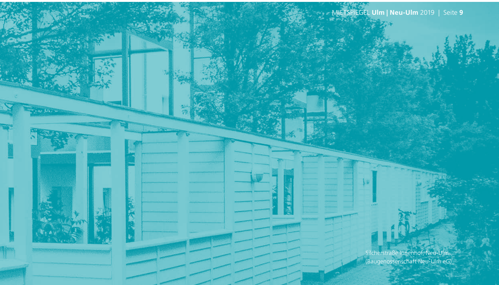
Sicherstraße Innenhof, Neu-Ulm (Baugenossenschaft Neu-Ulm eG)

Der Vermieter muss das Mieterhöhungsverlangen dem Mieter gegenüber schriftlich geltend machen und begründen. Als Begründungsmittel gesetzlich anerkannt sind Gutachten eines öffentlich bestellten und vereidigten Sachverständigen, die Benennung der Mietpreise von mindestens drei Vergleichswohnungen, von Mietdatenbanken und von Mietspiegeln.